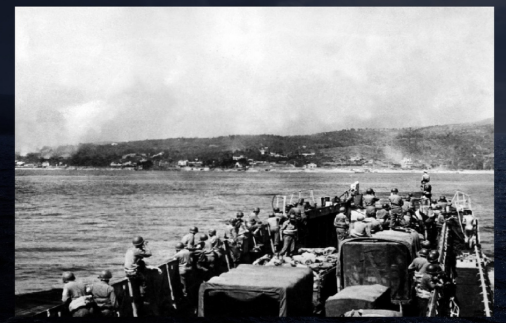
Débarquement, matin du 15 août

Plusieurs notions sont abordées dans cette station