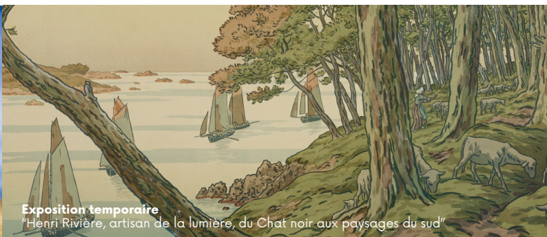
Exposition temporaire "Henri Rivière, artisan de la lumière, du Chat noir aux paysages du sud"