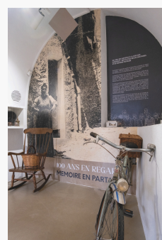
Visuels de l'exposition