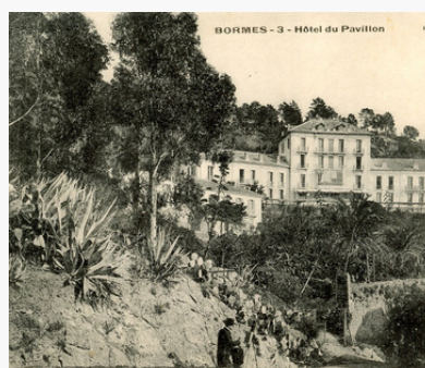
Carte postale ancienne