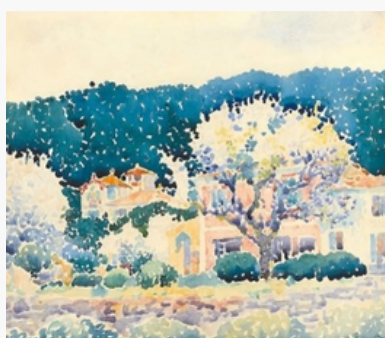
Grand hôtel 1905 H.E.CROSS_Collection particulière